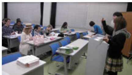
留学生への基礎研修

留学生向けの基礎研修は、後期から入学する短期留学生のために 10 月にも行われます。研修の際には、英語と日本語の両方を用いて、自転車利用の規則などの学生生活に関する決まりを主に説明しています。また、千葉大学の EMS に関してより正しい理解を得るために、「学生が作るエコキャンパス」と「ECO BOOK2010」の英語版を作成し、配布しています。