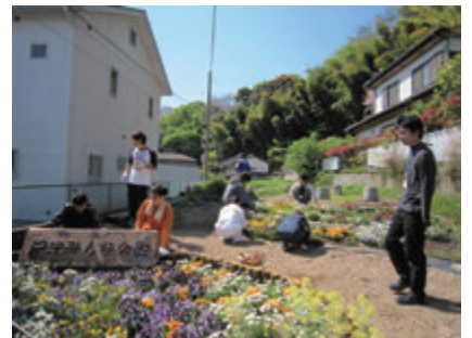
花壇整備による地域交流の様子

また、2月には松戸駅と松戸キャンパスを花でつなげる「花回廊」計画の足がかりとして、地域の方に花苗等の配布を行いました。ここでは花苗・土・鉢のセットを50、花の種・土・鉢のセットを50用意し、2時間という限られた時間でしたが91セットを配布しました。