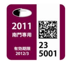
(一般) ステッカー (見本) 【南門特別駐輪場】 ステッカー (見本)