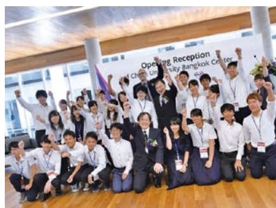
「千葉大学バンコク・キャンパス」の開所式

2017年9月、タイ及びアセアン地域の研究・教育交流をさらに発展させ、また主に学部生の留学拠点として活用することを目的として、タイのマヒドン大学インターナショナルカレッジ内に「千葉大学バンコク・キャンパス」を開設しました。