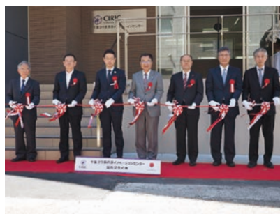
連携企業4社と合同で「包括連携共同研究推進等に関する協定」を締結

千葉大学は今春より「千葉ヨウ素資源イノベーションセンター:Chiba Iodine Resource Innovation Center」(CIRIC)を開所しました。千葉県で生産されるヨウ素は世界シェアのうち21%を占めており、同センターの設立により、これまで海外での生産が中心だった高付加価値ヨウ素製品の開発・製造拠点が千葉に置かれることとなります。次世代太陽電池の開発や資源のリサイクルなど、多彩なヨウ素の利用を推進していきます。