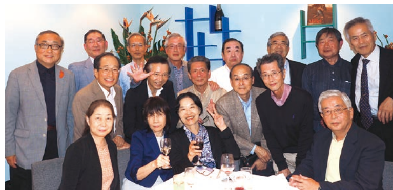
一昨年の同窓会にて

これに対応すべく、現在、速報版の論文、著作から、政省令・通達等を踏まえた本格的実務書や書式例集まで、5冊程度の執筆に追われています。