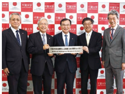
2018年5月には看板上掲式が行われました

2018年4月1日、医学研究院附属治療学人工知能 (AI) 研究センターが設置されました。本センターは、基礎医学研究ビッグデータと医療ビッグデータを基盤に人工知能 (AI) を構築し、実証研究及び臨床現場での利用を展開。そして新しい学問領域として「AI治療学」を創成し、革新的な基礎研究の推進、速やかで精度の高い診断法の確立、新たな治療法の開発、「AI治療学」を牽引する人材育成等を行っていきます。