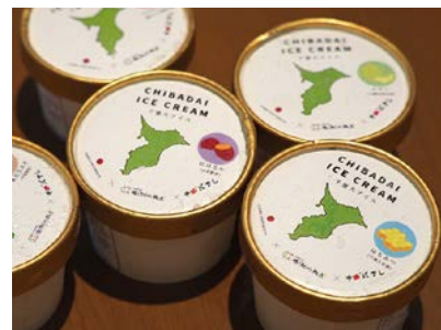
パッケージデザインも学生自身で手がけました

千葉大学COC+の取り組みの一環として学生が商品開発した「千葉大アイス」が、2018年3月より数量限定で発売されました。本企画は千葉大学生とチバテレ、ナミキアイス工房がコラボレーション。味の種類は千葉大学産のハチミツ、千葉県産のソウルフードと言われる味噌ピーナッツなど、地産のものを使うことにこだわっています。販路開拓も学生が手掛け、県内の道の駅や千葉大学生協等で店頭に並びました。