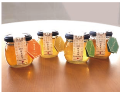
平成30年9月21日よりそごう千葉店で取り扱いを開始

都市養蜂研究のために西千葉キャンパス内に設置した養蜂箱から採取された蜂蜜が、このたび商品化されました。この蜂蜜は、研究の一環としてミツバチが巣に持ち帰る花粉のDNA分析がされており、商品パッケージには採取された月ごとの蜜源となった植物が明示されていることが特徴です。西千葉キャンパス内や周辺の街路樹・公園など千葉市内の草花から生まれた、「千産千消」にふさわしい蜂蜜となりました。