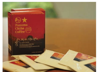
パナマ・千葉大学コーヒー

パナマと千葉大学の今後のさらなる発展を祈念した「パナマ・千葉大学コーヒー」が、長年にわたりパナマのコーヒー農園と深い信頼関係を築いているサザコーヒーの全面協力により完成しました。2018年3月1日には発売を記念したイベントならびにパナマとの友好式典を行い、国際教養学部学生とパナマの大学からの教職員・学生がコーヒーを通じて交流しました。