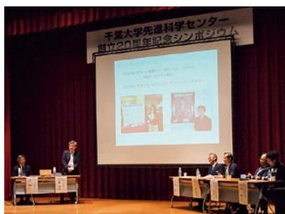
先進科学センター創立20周年記念シンポジウム

通常より1年早く大学に入学する機会を提供することで、若い才能の発掘と科学者育成を促進する「飛び入学」プログラムが、開始20周年を迎えました。日本で唯一の飛び入学専門推進機関である先進科学センターが1998年に飛び入学生を3名受け入れて以来、これまでに71名の卒業生を輩出しており、卓抜した実績を積み重ねています。