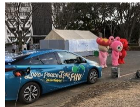
ハイブリッド自動車を電源 としたエコステージ