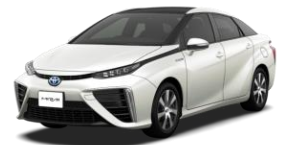
体験乗車を行う燃料電池自動車 (協力：千葉トヨペット株式会社)