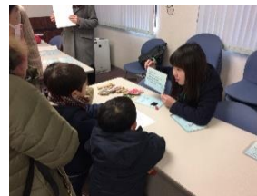
こども向けのエコ体験教室