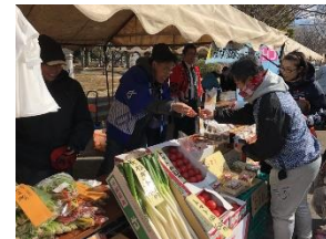
「千産千消」の特産品販売