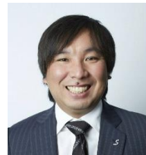
講演を行う里崎智也氏 (元千葉ロッテマリーンズ)