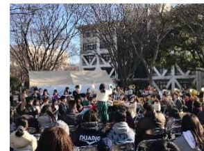
エコステージでの演奏