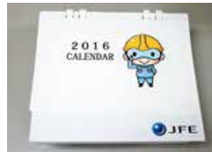
子どもたちが考えたお土産②カレンダー