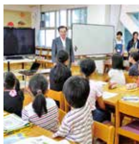
放課後起業塾の様子

二つ目が、スーパーグローバル大学創成支援事業への採択を受けて、本年4月から開講する「国際教養学部」の設置準備です。この新学部は、グローバル化に