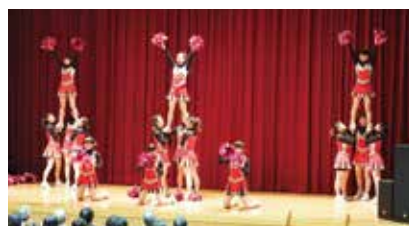
Lipsのパフォーマンス