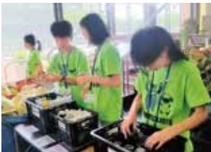
JFEスチール(株)工場見学準備の様子

このように大きく広がりを見せる西千葉子ども起業塾へ支援で大きく大変光栄に感じております。これからも支援を続けて参りたいと思っておりますので、今後ともご支援のほどよろしくお願いいたします。