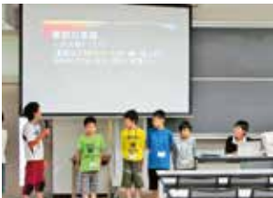
プレゼン発表の様子