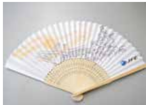
子どもたちが考えたお土産①扇子