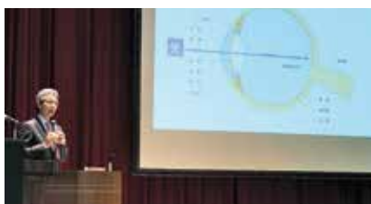
山本病院長による講演の様子