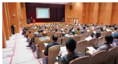
校友会総会の様子