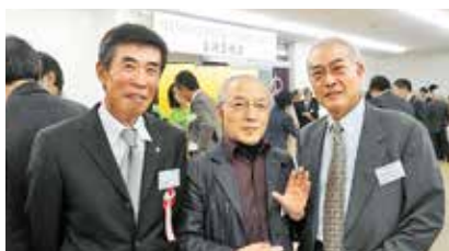
恩師と一緒に (左から川嶋会長、上松先生、大宮様)