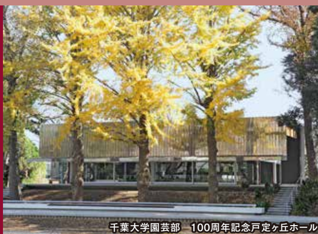
千葉大学園芸部 100周年記念戸定ヶ丘ホール