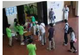
工場見学来場の様子