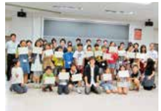
月イチ子ども起業塾に参加メンバー