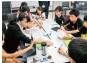
収支報告書を作成する子どもたち