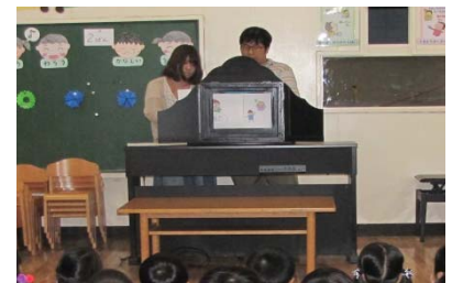
▲内容イメージ(紙すき、紙芝居の様子)