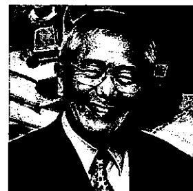
米パデュー大学 根岸 英一特別教授 (帝人グループ名誉フェロー) 帝人久村奨学生第5回生(1957年)

そして自らの「夢」を見つけたら真理を突き詰めるまで、とことんチャレンジしてください。今後の皆さんの大いなる活躍に期待しています。