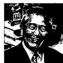
Purdue University Distinguished Professor Mr. Ei-ichi Negishi (Teijin Group Distinguished Fellow) 5th year Teijin Kumura scholarship (1957)

When you find your own "Dream", please challenge it thoroughly until the truth is investigated. I look forward to your great success in the future.