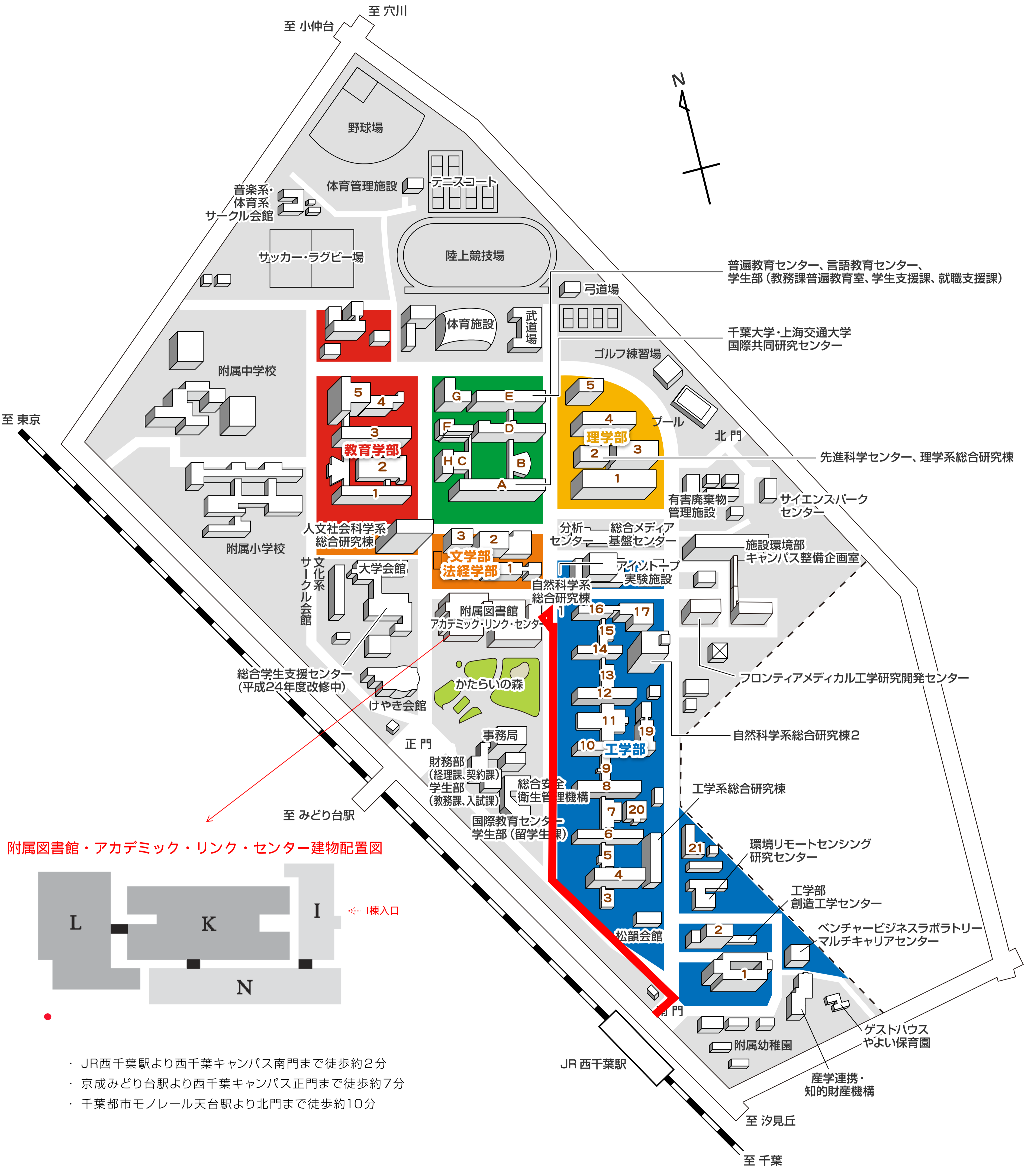
附属図書館・アカデミック・リンク・センター建物配置図